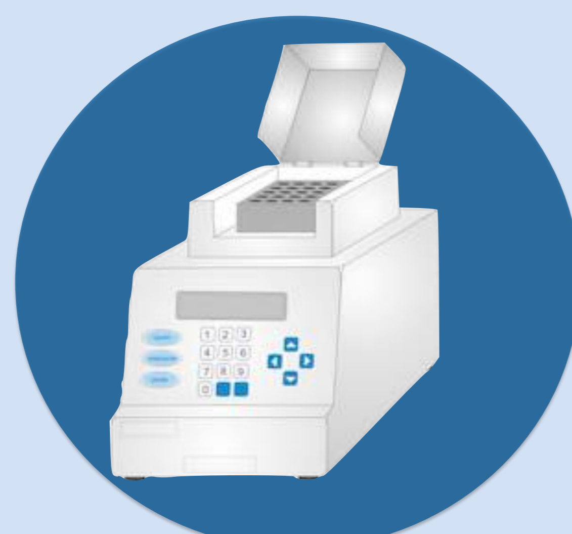
3. Realización del PCR.