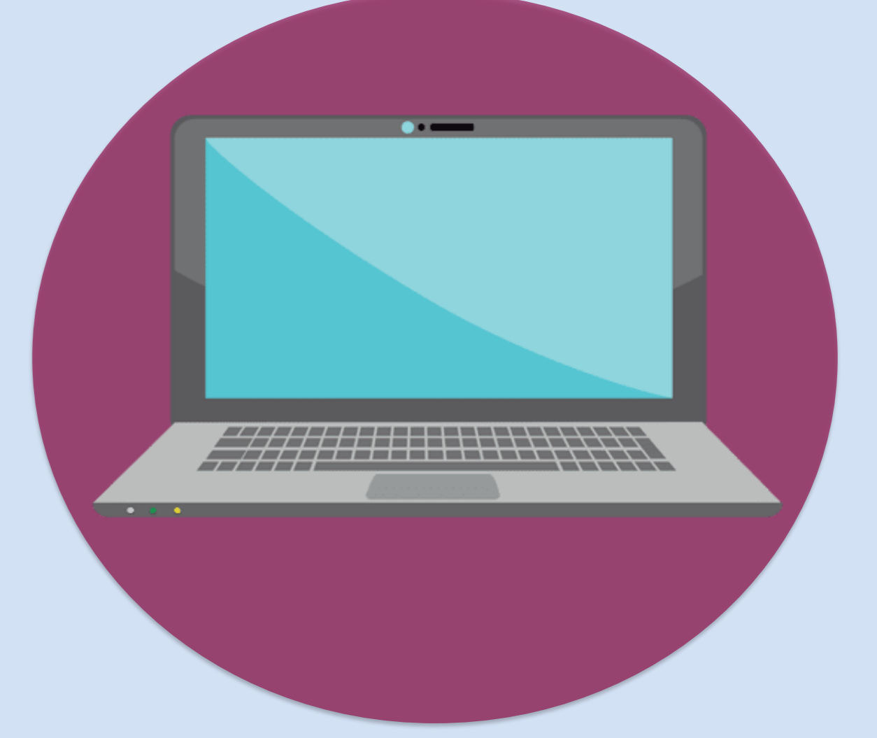
4. Análisis bioinformático a través de DNA Subway.