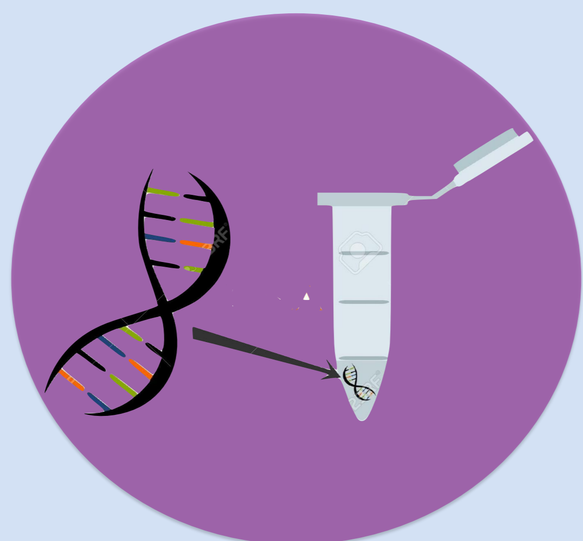
2. Extracción de DNA.